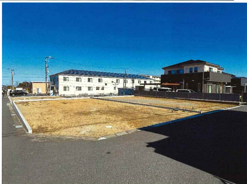
■ 図面と現況が相違する場合は現況優先とさせていただきます。