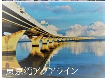
東京湾アクアライン

□アクアライン高速バス□ 君津駅南口より羽田空港・品川駅・東京駅行 が運航されております。